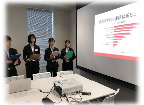
東京研修旅行: 企業訪問