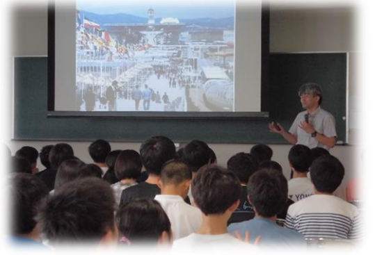
未来展望セミナー