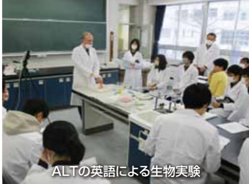
ALTの英語による生物実験