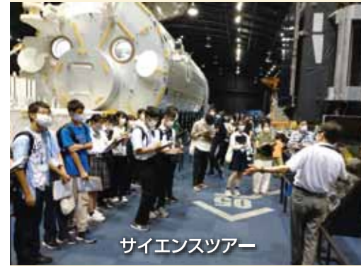
サイエンスツアー