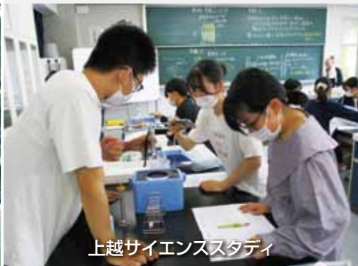
上越サイエンススタディ