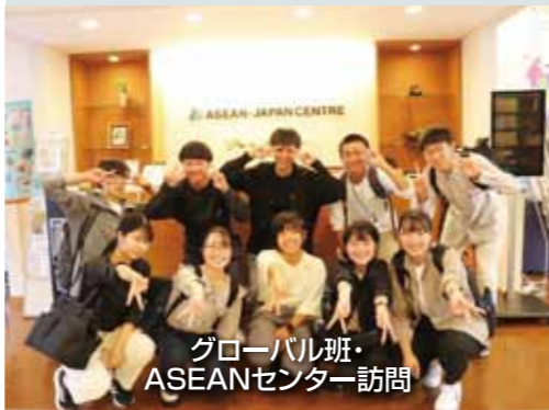
グローバル班・ASEANセンター訪問