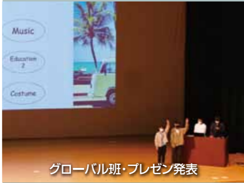
グローバル班・プレゼン発表