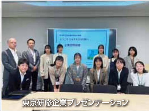
東京研修企業プレゼンテーション