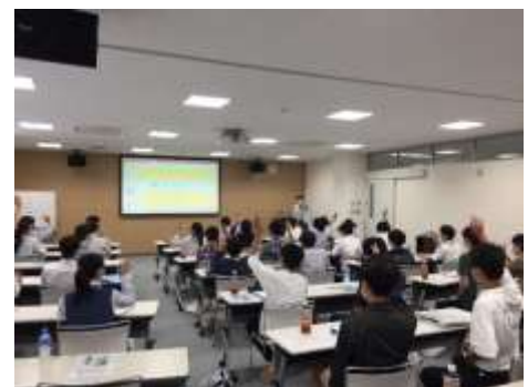
上越環境科学センターでの講義