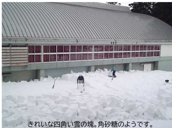
きれいな四角い雪の塊。角砂糖のようです。

今年は積雪もそれほど多くなく、日中には日が差す時間帯もあり、比較的穏やかな過ごしやすい日が続いています。それでも朝晩は冷え込みが厳しく、路面が凍結することもあります。生徒玄関までの坂道は滑りやすくなっていますので、登下校の際、足元には十分注意してください。