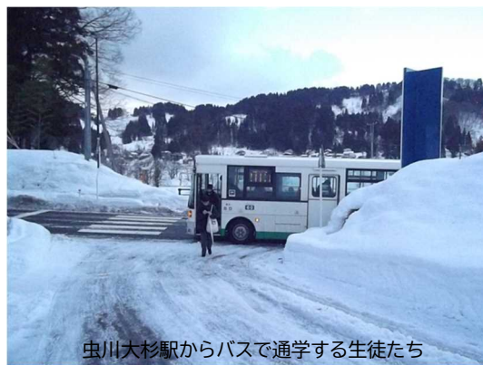
虫川大杉駅からバスで通学する生徒たち

体育館の屋根から落ちた雪の山を学校技術員さんがノコギリでカットし、スノーダンプを使って除雪しています。写真では伝わりにくいかもしれませんが、きれいな四角形の雪の塊が見えます。安塚区の冬の雪景色も美しいですが、それにも勝るとも劣らない芸術作品です。普段から校舎内外ともきれいに整備していただいている学校技術員のおふたりにはいつも助けられており、自慢の校舎です。