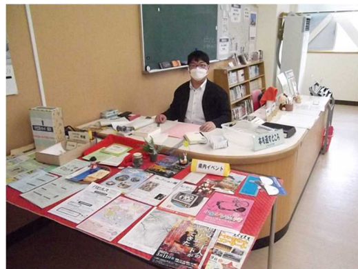
みなさんの利用を待っています。

体育館の屋根から落ちた雪の山を学校技術員さんがノコギリでカットし、スノーダンプを使って除雪しています。写真では伝わりにくいかもしれませんが、きれいな四角形の雪の塊が見えます。安塚区の冬の雪景色も美しいですが、それにも勝るとも劣らない芸術作品です。普段から校舎内外ともきれいに整備していただいている学校技術員のおふたりにはいつも助けられており、自慢の校舎です。