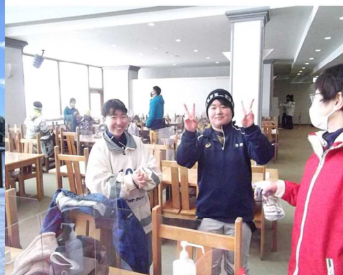
お昼休憩の様子。ボリュームたっぷり大盛りカレーライス。おいしかったです。(写真:上・下)