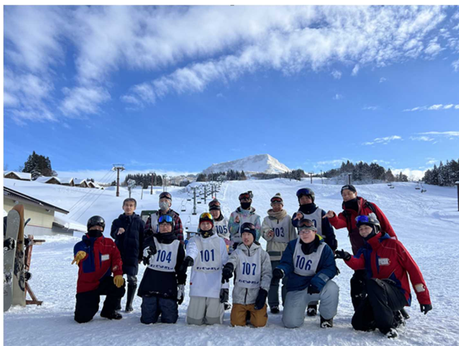
青空の下、メインゲレンデ前での集合写真。 担任、インストラクターと一緒に。(写真:左)

1月31日(火)、地元安塚区にあるスキー場、キューピットバレイで2年生がスノーボード授業を行いました。前週は荒天が続いていたため、天候が心配されましたが、午前中は少し雪が舞う程度、午後からは写真でもお分かりのとおり、風もない絶好の晴天に恵まれました。自然豊かな雪国、安塚区の特徴を生かし、昨年度からスキー授業に加え、スノーボード授業も取り入れました。生徒たちはインストラクターの指導に従い、先生たちが見守る中、試行錯誤を繰り返し、冬の安塚を満喫していました。