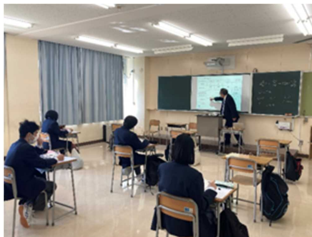
2年 化学 モルの計算も視覚的に説明