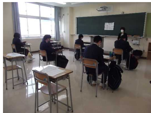
2年生はまず全体説明から

今回のガイダンスは、2部制で行いました。第1部では、2年生は就職の全般的な説明、3年生は進学・就職に分かれての総合説明を行いました。第2部では、2年生は職業・進学探究ガイダンス。3年生の進学希望者は各学校の個別相談、就職希望者はハローワークの方との面談を行いました。生徒たちはみんな真剣に臨んでいました。