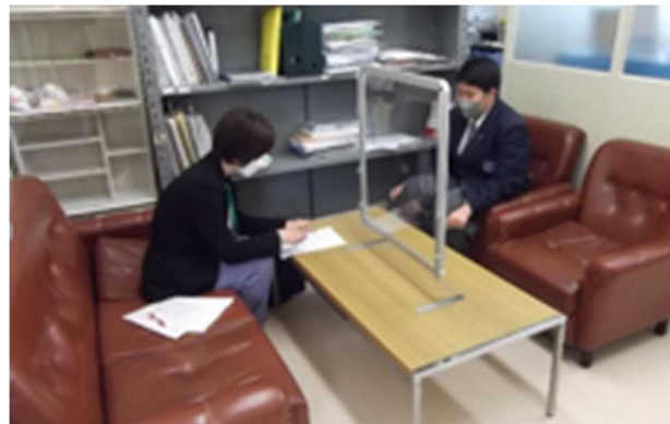
ハローワークの方との面談 しっかりと受け答えをしていました。 求人票の公開ももうすぐです。