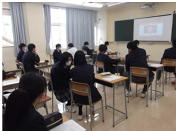
何が問題か生徒が話し合っている様子

この動画は日常生活でも起こりうる3つの動画をもとに問題出題形式となっていて生徒同士で何が問題かを話し合いながら学びました。スマホはとても便利なツールですが、一つ間違えると大きなトラブルにつながります。使用する際は十分に気をつけましょう。