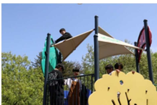
昼食後の公園での異学年交流

生徒の感想からも、フォッサマグナ ミュージアムまでの坂道を歩いた後のすがすがしい気持ちや異学年との交流、ヒスイやフォッサマグナ学習をとおしての糸魚川市の魅力を再発見するなど今回の遠足で学ぶことは多かったようです。今回の遠足の目的（集団行動での協調性、クラス内、異学年間交流と融和、地域の見聞を広める）のすべてが達成できたよい遠足となりました。