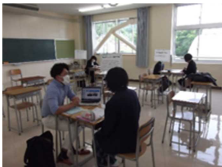
希望する学校との個別相談でより具体的に