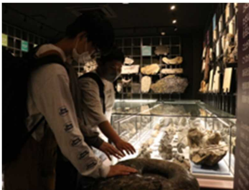
いろいろな形の石に興味津々