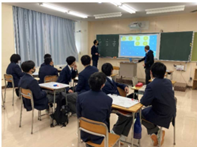
3年 コミュニケーション英語Ⅲ ALT とのチームティーチング

先生方は試行錯誤、創意工夫を重ね、生徒一人一人に合った個別最適な学びと卒業後の進路を見据えた協働的な学びをとおして学力向上を目指しています。ICTを活用した授業も推進しています。