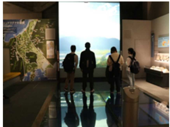
200インチの壁床一体型スクリーンでフォッサマグナ誕生を学ぶ