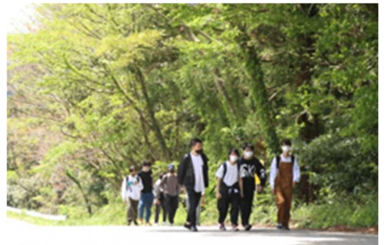
春の穏やかな日差しの下フォッサマグナミュージアムまでの道のり

糸魚川市では、「糸魚川フォッサマグナミュージアム」を見学しました。日本列島の生き立ちやヒスイ、生物の進化、地球のことなどさまざまなことを学んできました。