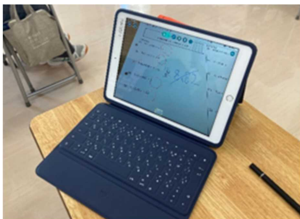
生徒：先生から採点したものが送られてきました

3年生の数学総合授業では、iPad（ロイロノート）を使い、小テストを行っていました。生徒はそれぞれのペースで問題を解き、写真に撮って先生に送信します。先生は生徒から送られてきた解答を採点して生徒に送り返します。一斉授業も必要ですが、生徒一人一人のペースに応じた授業の進め方を大切にしています。生徒はみんな真剣に問題に取り組み、競い合うように先生に解答を送信していました。