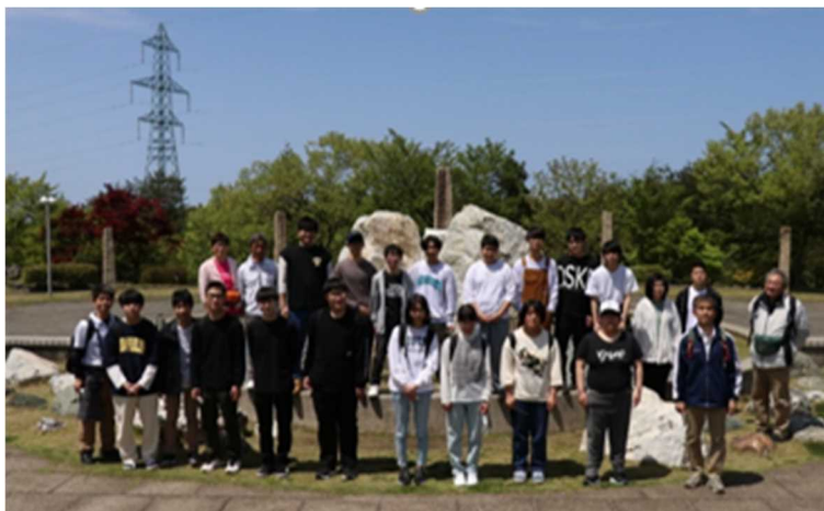
集合写真(フォッサマグナ ミュージアム)