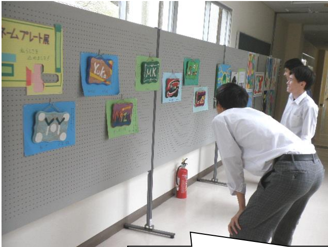
3年生が制作した「ネームプレート展」を開催しています。 美しく描かれたデザイン作品が生徒玄関前の空間を彩っています。