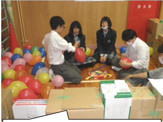
2年生が出店した「ボーリング・風船くじ」。 みんなで遊んでお菓子をゲット！