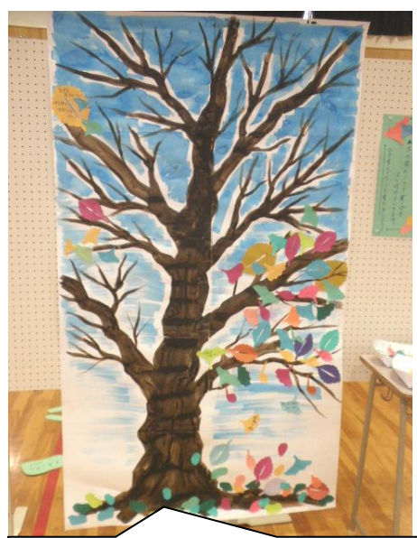
色紙の葉っぱを貼って、みんなで安塚のオータムツリーを完成 させるワークショップ。当日は美しい紅葉が見られるはずですよ。