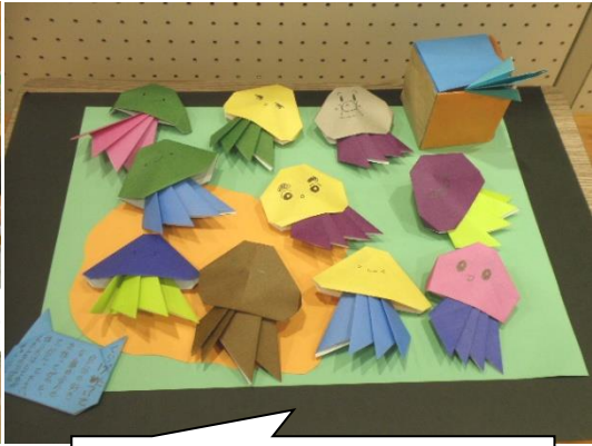
折り紙好きな3年生女子のクラゲ達。 子供たちへのプレゼントです。