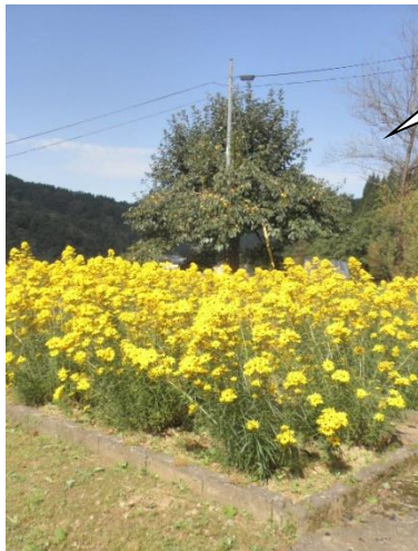
10月には校庭の柳葉ひまわりが咲き、 秋の高い青空に映えていました。