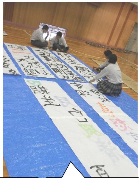
書道選択者も熱心に展示の準備をしていました。