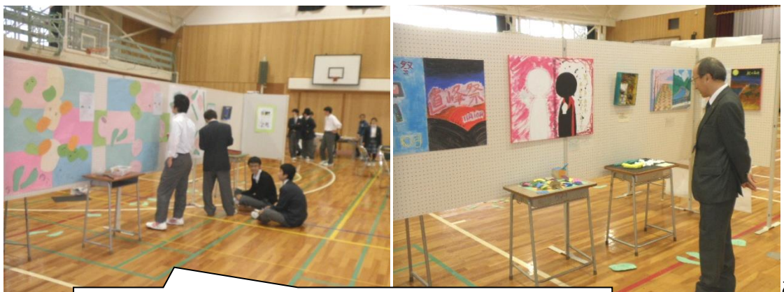
来場された方も文化祭に参加して楽しんでもらえるワークショップ 「おかおいっばい大作戦」です。友達、宇宙人、バッタなどの顔を 愉快地描いて遊びます。さて当日は何人の人口が増えたでしょうか？