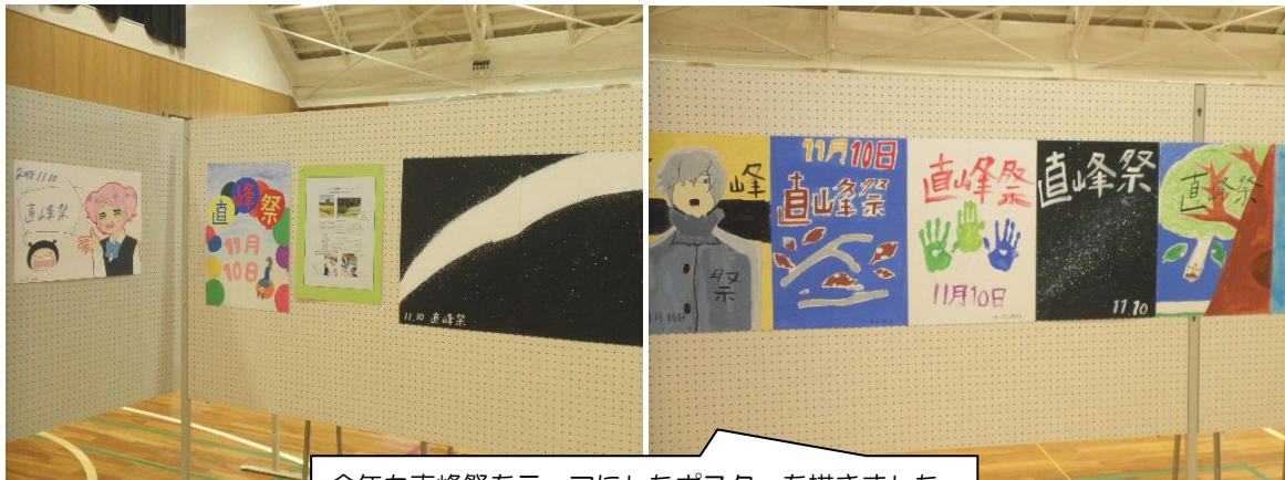
今年も直峰祭をテーマにしたポスターを描きました。 それぞれの個性が表現されています。